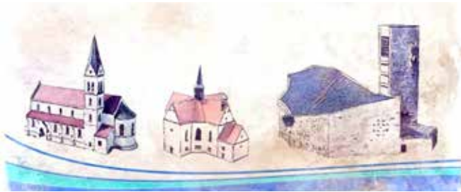
St. Salvator - St. Korona - St. Konrad