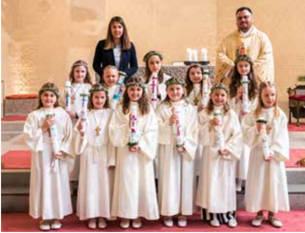
Erstkommunion in Hacklberg, 23. April 2022