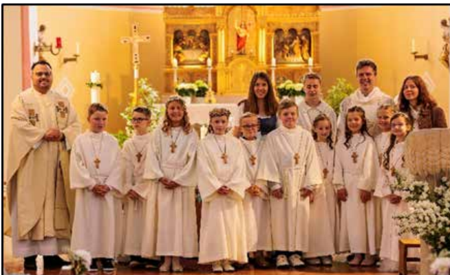
Erstkommunion in Schalding, 14. Mai 2022