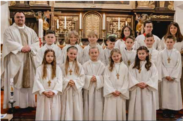
Erstkommunion in Korona, 07. Mai 2022