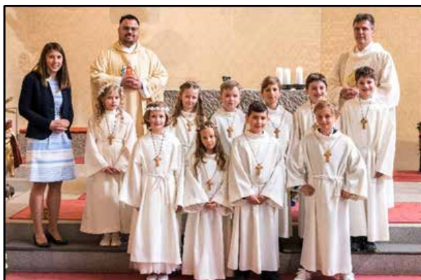
Erstkommunion in Hacklberg, 23. April 2022